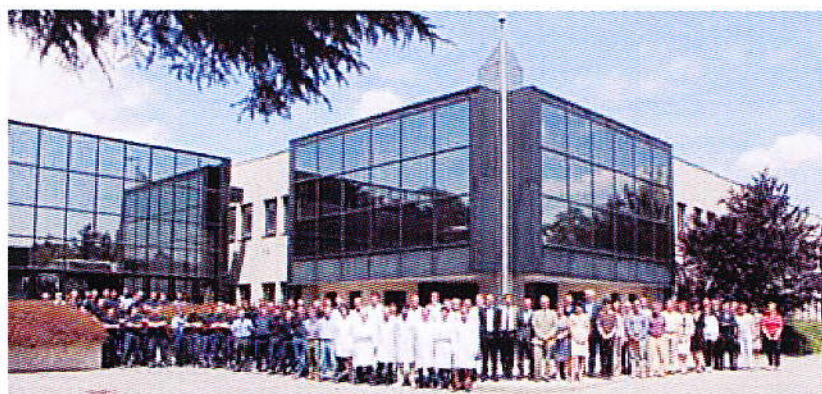
LO STAFF AZIENDALE DELLA SEDE DI SEGRATE

i EUROSICMA SEGRATE (MI) TEL. (+39) 02 218961